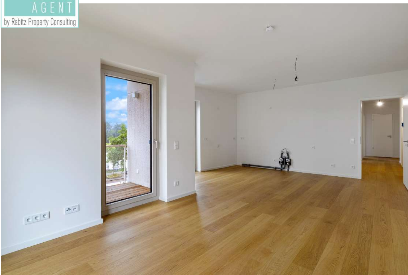
Wohnbereich mit offener Küche