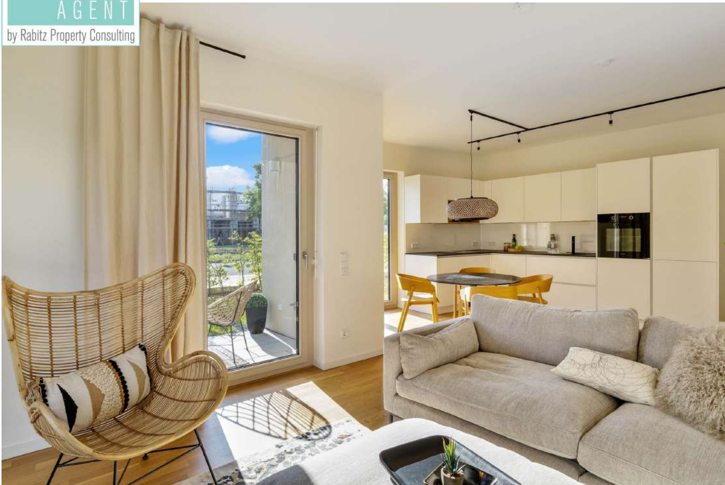
Beispiel: Wohnbereich mit offener Küche

# YOUR BERLIN AGENT by Rabitz Property Consulting