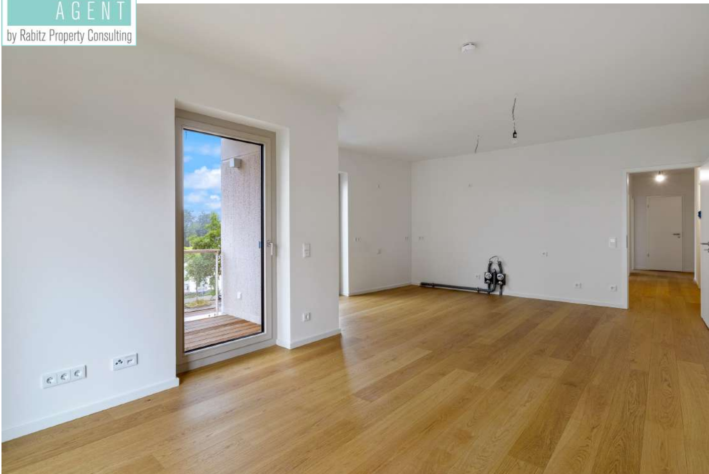
Wohnbereich mit offener Küche