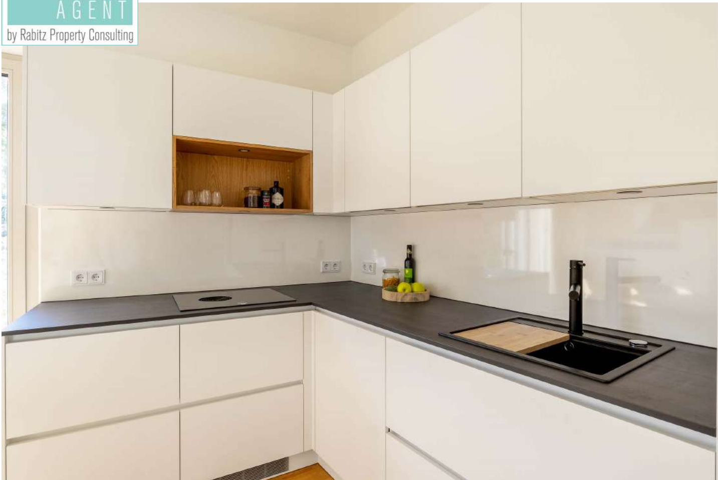
Wohnbereich mit offener Küche