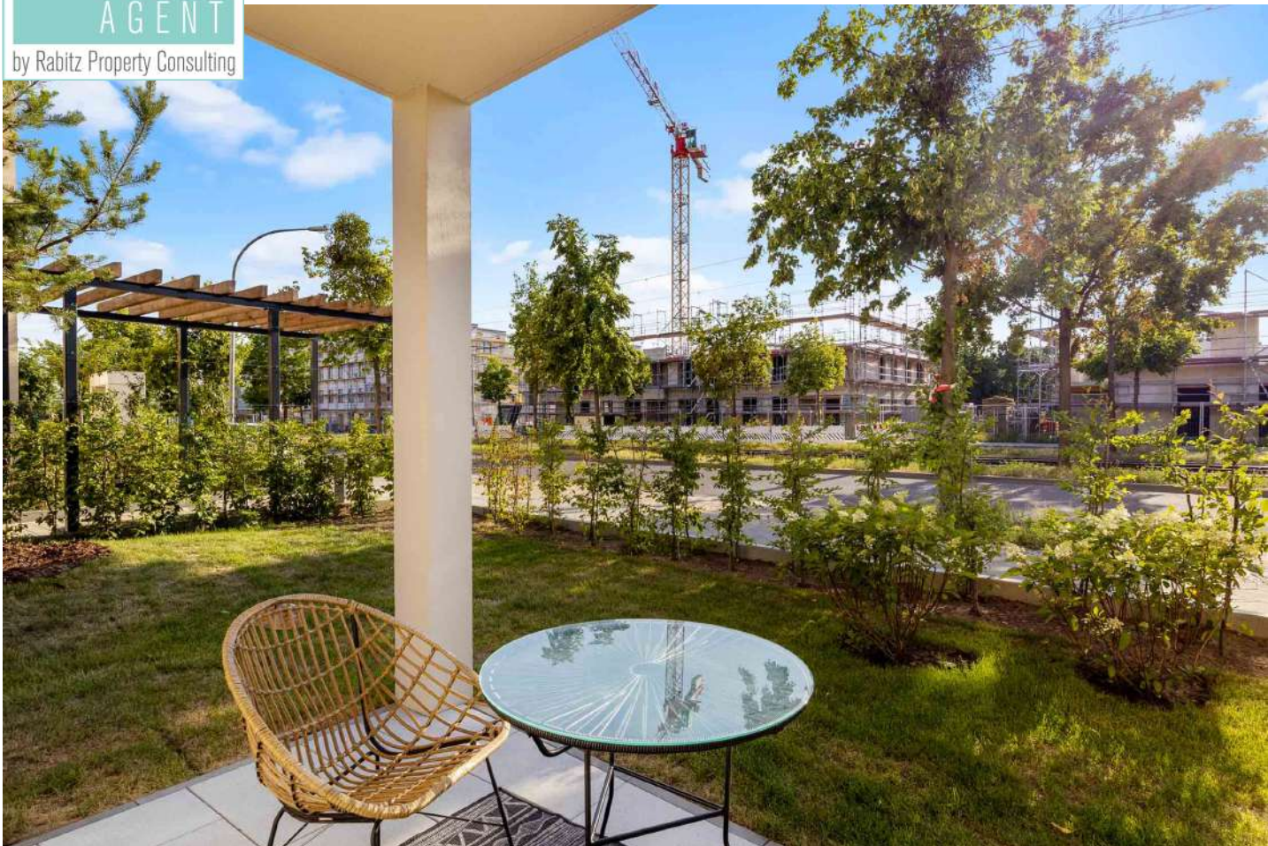
Terrasse und Garten